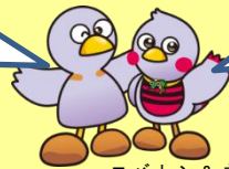
コバトン&さいたまっち

保護者の会の皆さんとお話ししてみませんか 子供とどのように関わったら良いのだろう。 同じ悩みをもった人と話しができないかな。 こんな交流の場があります。